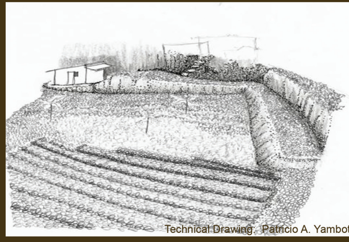
Technical Drawing: Patricio A. Yambot