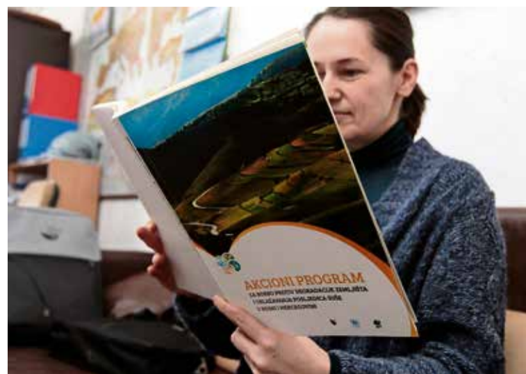
BiH je dio globalnih trendova u brizi za tlo

“Zemljište kao komponenta okoliša, a istovremeno strateški najvažniji prirodni resurs, ima baznu ulogu u tom strateškom dokumentu. Ovaj projekt će nam pomoći da to uradimo na najbolji način”, kaže Cero.